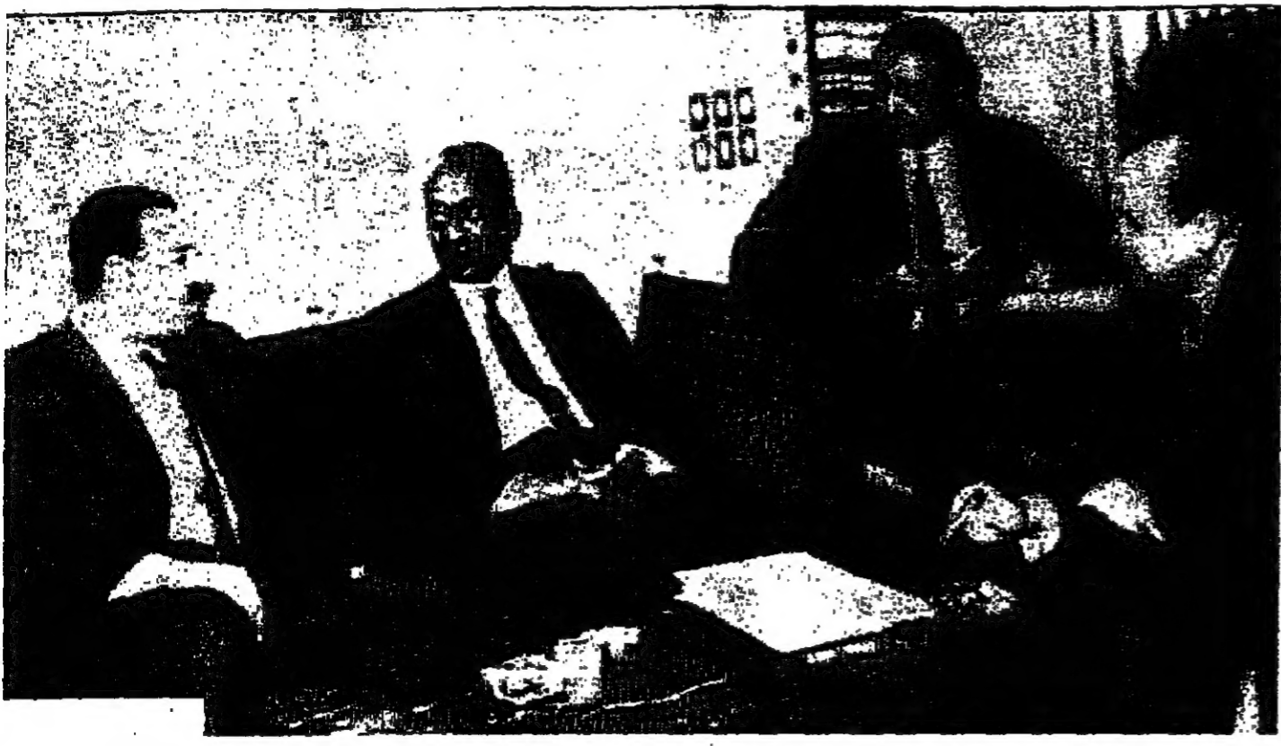
الجنة العربية الثلاثة للسلام في الرباط خلال اجتماعها في القاهرة يوم السبت الماضي . ويرى من اليسار السيد اسمايل المرقي فاسيد محمد احمد محجوب رئيس وزراء السودان ثم السيد عثمان الحضري سفير السودان في القاهرة فاسيد احمد بن بروت

القاهرة - صرح الدكتور عبد المنعم العام المساعد لحكومة الدول العربية بسان الامة العمة وجهت الدعوة الى جلسة طارئة لمجلس الوزراء العرب في الرباط في يوم غد السبت بناء على طلب حكومة المغرب لبحث بعض المسائل المتعلقة بمؤتمر القمة العربي المقرر عقده في الرباط في التاسع عشر من الشهر الحالي على ضوء الاتصالات التي قام بها الدكتور احمد للفرقي وزير خارجية المغرب مع كل من السعودية وسورية حول هذا الموضوع .